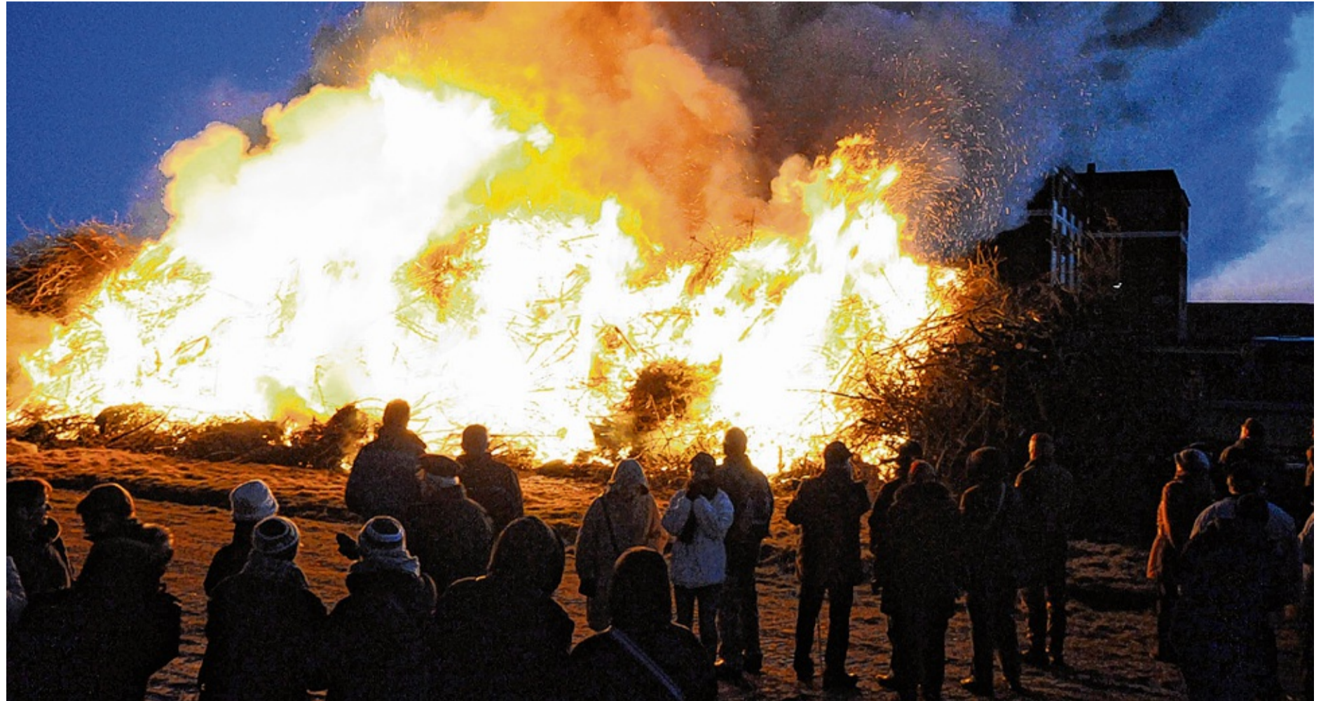
Anziehungspunkt für Menschen aus nah und fern: die traditionellen Biiken auf den Inseln und Halligen sowie auf dem nordfriesischen Festland.